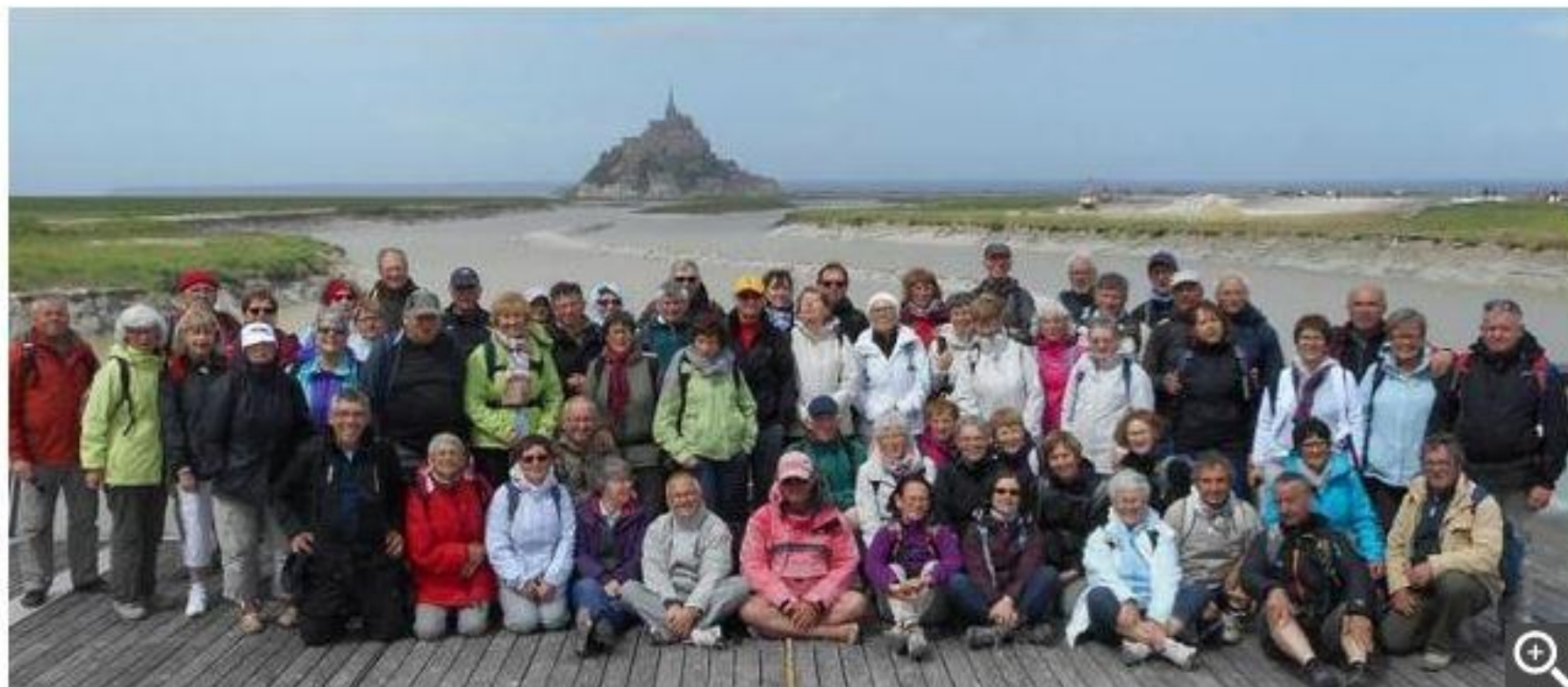
Un paysage superbe le long des chemins côtiers.